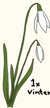
1 x vintergæk