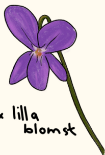
1 x lilla blomst