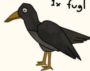
1 x fugl