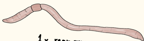
1 x regnorm