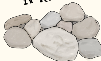
1 x stenbunke