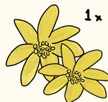
1 x gul blomst